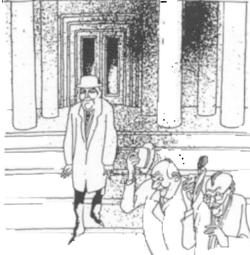
„Die Psychiater haben sich gebessert: nach 1945 keinen einzigen nachweisbaren Mord mehr.“

lieben‘ Nachbarn und Mitmenschen einen Störer ausgemacht haben, den sie loswerden wollen, brauchen sie diesen nur beim jeweiligen Sozialpsychiatrischen ‚Dienst‘ anschwärzen. Und dieser, der auf jeden – auch anonymen – Anruf reagieren muß, muß mit seinen psychiatrischen Mitteln (Registrierung, Vorladung auch unter Polizeigewalt, gemeinde-nahem Abspritzen an Ort und Stelle unter Anwendung unmittelbarer Gewalt, Einlieferung in die Anstalt, Einschüchterung und Androhung derselben) seine vorgesehene Gesetzespflicht erfüllen.